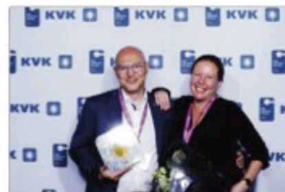
Verkiezing als springplank

Het MKB is de motor van innovatie in Nederland. Dat verdient een podium! Deze mooie verkiezing biedt dit podium.