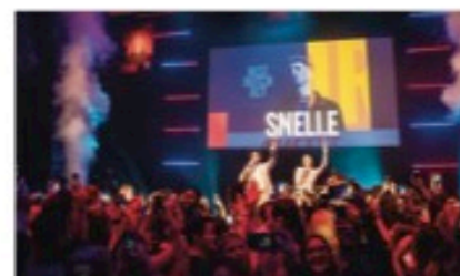
Ook Nederlandse winnaars bij de MTV Awards

De actie van Kanye West is één van de meest historische momenten van MTV. Memes met de woorden 'I'ma let you finish' duiken nog steeds vaak op internet op.