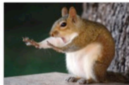
Animal Crackers in beeld

Met veel goed foto's die bij iedereen een glimlach op het gezicht toveren, wordt er op een positieve manier aandacht gevraagd voor een serieuze zaak.