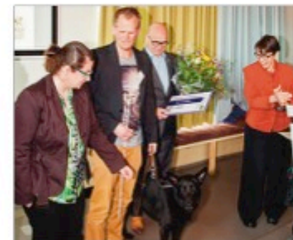
Om blind op te vertrouwen