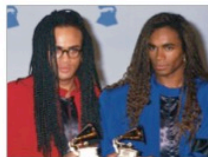
De mannen Milli Vanilli met hun Grammy Award

Een prestigieuze verkiezing met in 2010 meer dan 80(!) verschillende categorieën, die ondanks schandalen nog steeds staat als een huis.