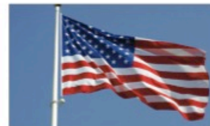
De lange schaduw van the Sunshine State