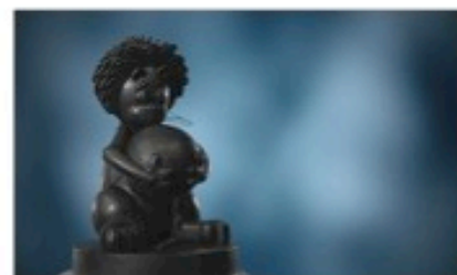
Afgemeten! Een prijs die reclamemakers met lood in hun schoenen in ontvangst nemen.

Grootste kanshebbers voor de Loden Leeuw zijn de betuttelende commercials gebleken. Een verkiezing dus waarbij het publiek niet alleen de slechtste commercial kiest, maar ook toont wat het minst aanspreekt.