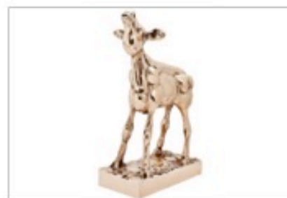
Het Kalf van Rijk de Gooyer

Het is bijzonder hoe er tot 3x toe een prestigieuze prijs wordt uitgereikt aan een door een vakjury gekozen winnaar, die even zo vaak de prijs accepteert en vervolgens met grote minachting van zich afsnijdt. Een ambivalente relatie.