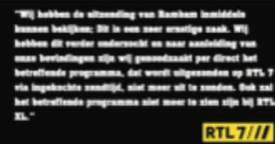
Toch niet zo'n succes