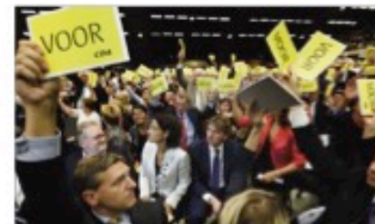
Voor stemmen als je ergens tegen bent