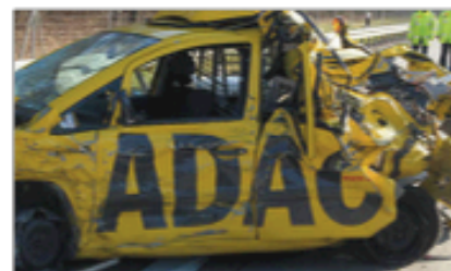
Total Loss: De Gelber Engel Award

Een verkiezing moet geloofwaardig zijn. Hiervoor is het allerbelangrijkste dat de uitslag van de verkiezing eerlijk is. Deze verkiezing verloor alle geloofwaardigheid en daarom dus geëindigd in de onderste regionen van de ranglijst!