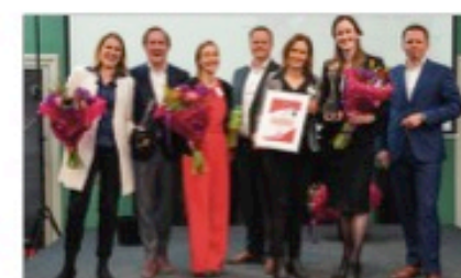
Three winnaars bij de editie in 2019